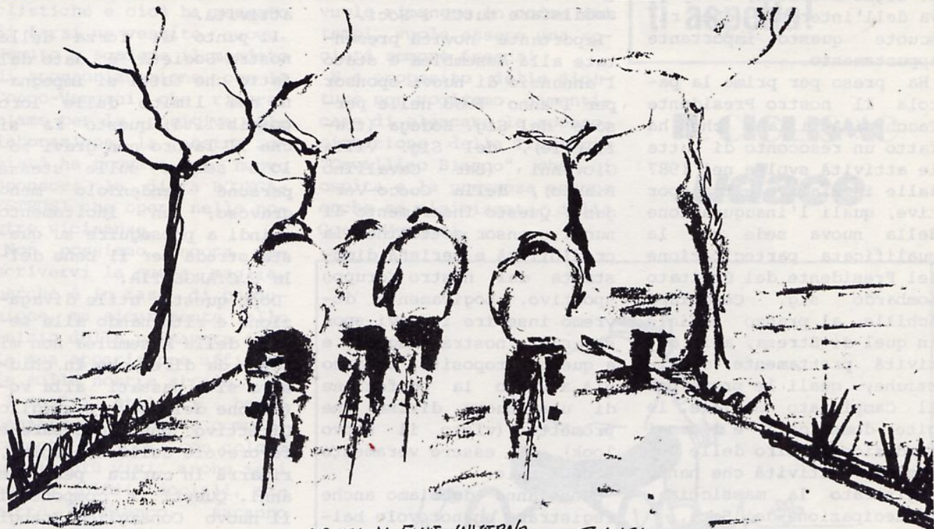
USCITA DI FINE INVERNO

Notiziario di informazione a cura della Soc. Ciclistica Amatoriale Argentia - Gorgonzola Sede: Via per Cascina Antonietta Tel. 9513692 - Stampato in proprio - Data Febbraio Num. 6