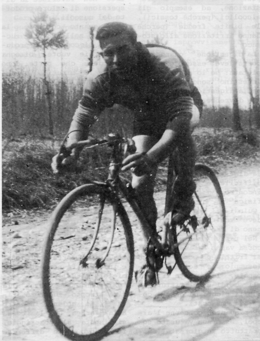
Giovanni Morandi - Anno 1936 Olgiate Comasco